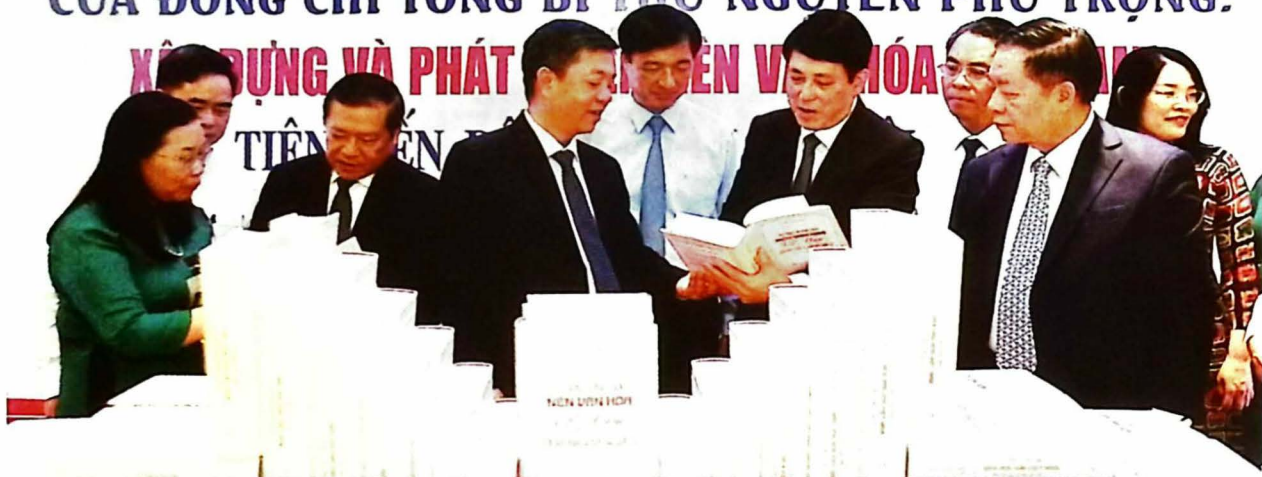
Đồng chí Lương Cường, Ủy viên Bộ Chính trị, Thường trực Ban Bí thư và các đại biểu tại Lễ ra mắt cuốn sách "Xây dựng và phát triển nền văn hóa Việt Nam tiên tiến, đậm đà bản sắc dân tộc" của Tổng Bí thư Nguyễn Phú Trọng.

phát triển văn hóa, con người Việt Nam những năm qua là thành quả của toàn Đảng, toàn dân và toàn quân ta, trong đó nhân tố quan trọng nhất, có ý nghĩa quyết định là sự lãnh đạo trực tiếp, toàn diện của Đảng, đứng đầu là đồng chí Tổng Bí thư Nguyễn Phú Trọng.