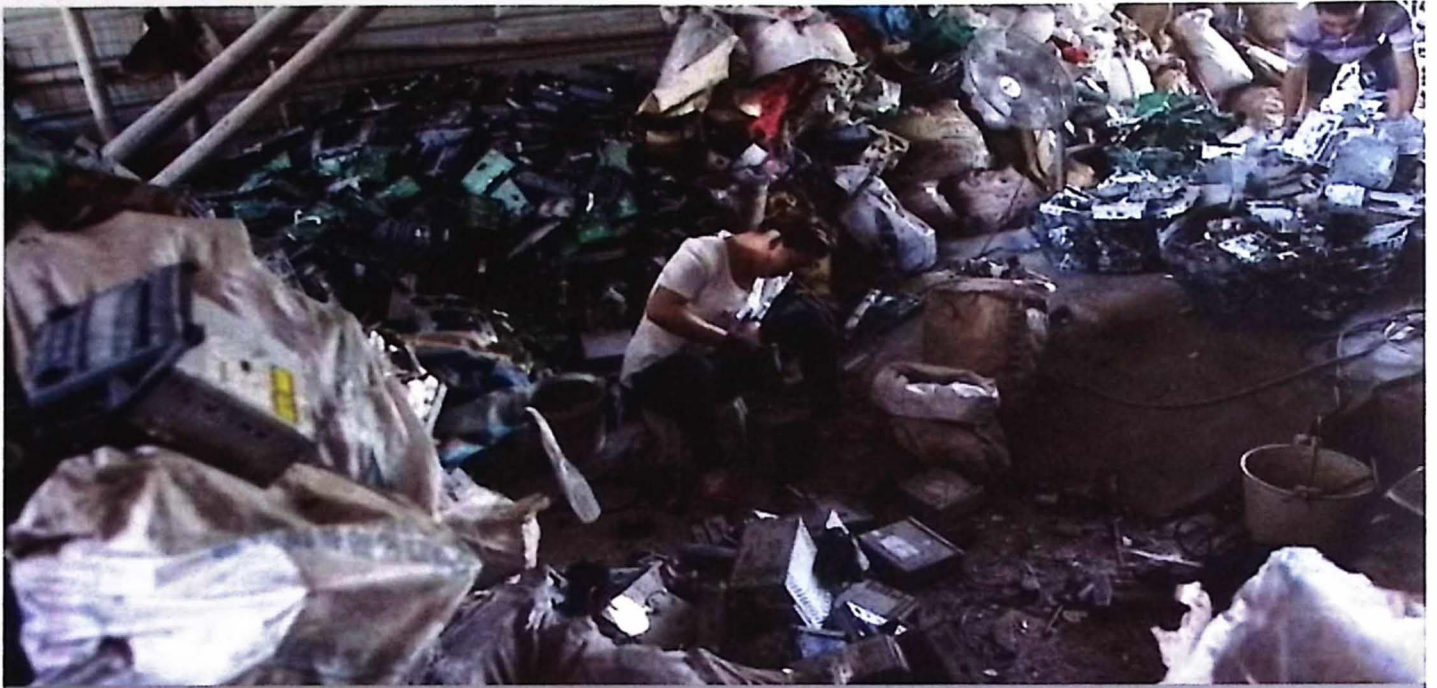
Xử lý rác thải điện tử không đúng cách sẽ gây nguy hại đối với sức khỏe con người và môi trường.