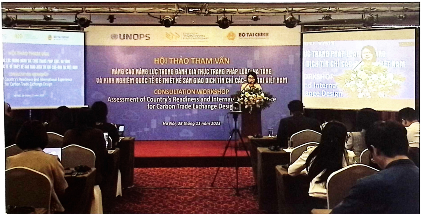
Hội thảo tham vấn nâng cao năng lực trong đánh giá thực trạng pháp luật hạ tầng và kinh nghiệm quốc tế để thiết kế sàn giao dịch tín chỉ carbon tại Việt Nam.

thải khí nhà kính trên toàn châu Âu và 3/4 thị trường thế giới. Tại châu Á, Trung Quốc là quốc gia đưa nội dung hình thành thị trường tín chỉ carbon vào kế hoạch phát triển giai đoạn 2011-2015 và đang thí điểm thực hiện trên phạm vi rộng tại nhiều khu vực với các mức độ áp dụng đa dạng, linh hoạt. Trung Quốc chính thức đưa thị trường giao dịch tín chỉ carbon vào vận hành từ ngày 16/07/2021, hướng tới mục tiêu trung hòa carbon vào năm 2060.