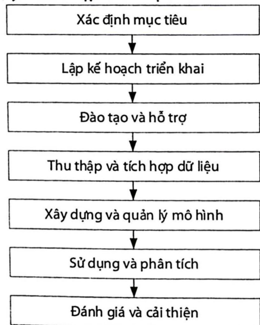
Hình 2. Quy trình tích hợp BIM cho truyền thông dự án