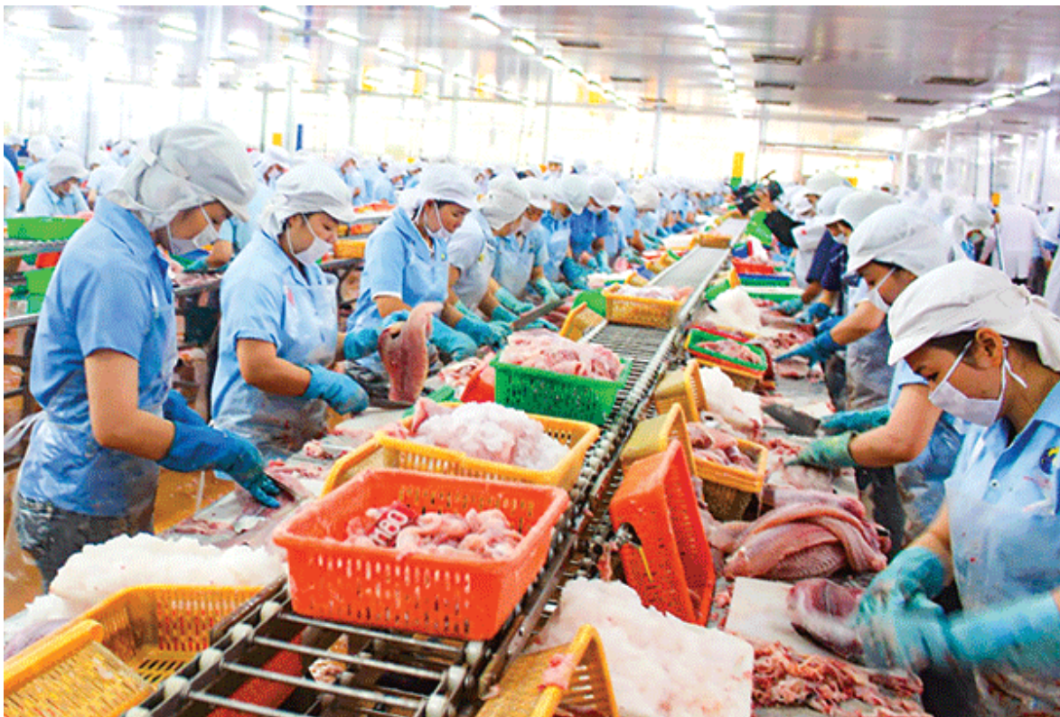
Dây chuyền chế biến cá tra phi lê xuất khẩu của Công ty TNHH MTV Ấn Độ Dương.

Bức tranh công nghiệp của TP. Cần Thơ có nhiều “mảng màu sáng” với sự đầu tư của các nhà đầu tư thứ cấp vào các khu công nghiệp (KCN), là dấu ấn của doanh nghiệp khi không ngừng đầu tư khoa học công nghệ, chinh phục thị trường nội địa lẫn quốc tế... Tuy nhiên, vẫn còn những “mảng màu” mờ nhạt khi phát triển công nghiệp chưa tương xứng với tiềm năng, lợi thế, chưa theo kịp định hướng quy hoạch và kỳ vọng của thành phố. Để định hình lại bức tranh công nghiệp trong giai đoạn mới, việc hợp sức khơi thông các nguồn lực còn đang để ngỏ là rất quan trọng.