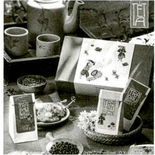
Họa tiết tranh Hàng Trống Canh nông vi bản , ứng dụng trên bao bì sản phẩm quà Tết của The Bloom

người tiêu dùng, tạo sự thiện cảm và gần gũi. Phong cách độc đáo của nghệ thuật dân gian đã trở thành cảm hứng cho các nhà thiết kế sáng tạo, đặc biệt, trong lĩnh vực thiết kế bao bì sản phẩm tiêu dùng. Tuy nhiên, khi nói đến nghệ thuật dân gian, mọi người sẽ liên tưởng ngay đến những gì xưa cũ, lỗi thời, còn nói đến thiết kế hiện đại thì sẽ mang tính năng động, mới lạ. Đây cũng là thách thức đối với các nhà thiết kế bao bì trong việc tích hợp giữa văn hóa dân gian vào thiết kế hiện đại, làm nổi bật các giá trị văn hóa dân tộc, xây dựng hình ảnh về đất nước Việt Nam giàu bản sắc văn hóa.