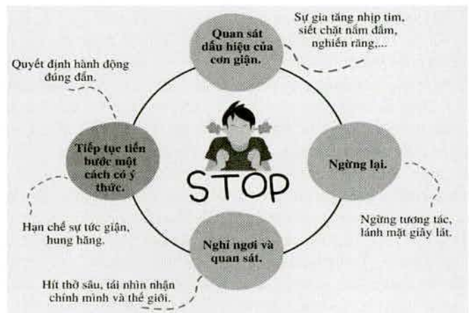
Hình 1. Các bước thực hiện phương pháp STOP

- Phương pháp WOOP : HS tham gia lên kế hoạch đặt mục tiêu cho năm học mới theo phương pháp WOOP (W-wish: mong muốn, O-outcome: kết quả, O-obstacle: trở ngại, P-plan: kế hoạch).