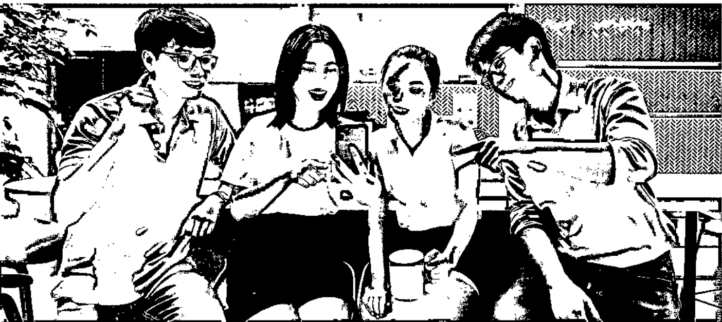
Sinh viên Gen Z có ý thức trang bị kiến thức và kỹ năng về tài chính cá nhân hơn hẳn thế hệ trước

đó. Gen Z có thể tự kiểm tra số dư thông qua ứng dụng trực tuyến, sử dụng ứng dụng tiết kiệm trực tuyến, chuyển tiền giữa các tài khoản nhanh chóng và biết chắc chắn mình có bao nhiêu tiền để quản lý. Gen Z cũng thích hưởng thụ và “biết hưởng thụ” hơn thế hệ trước nhưng họ cũng ý thức phải tìm kiếm và áp dụng các khoản được ưu đãi, chiết khấu, hoàn tiền.