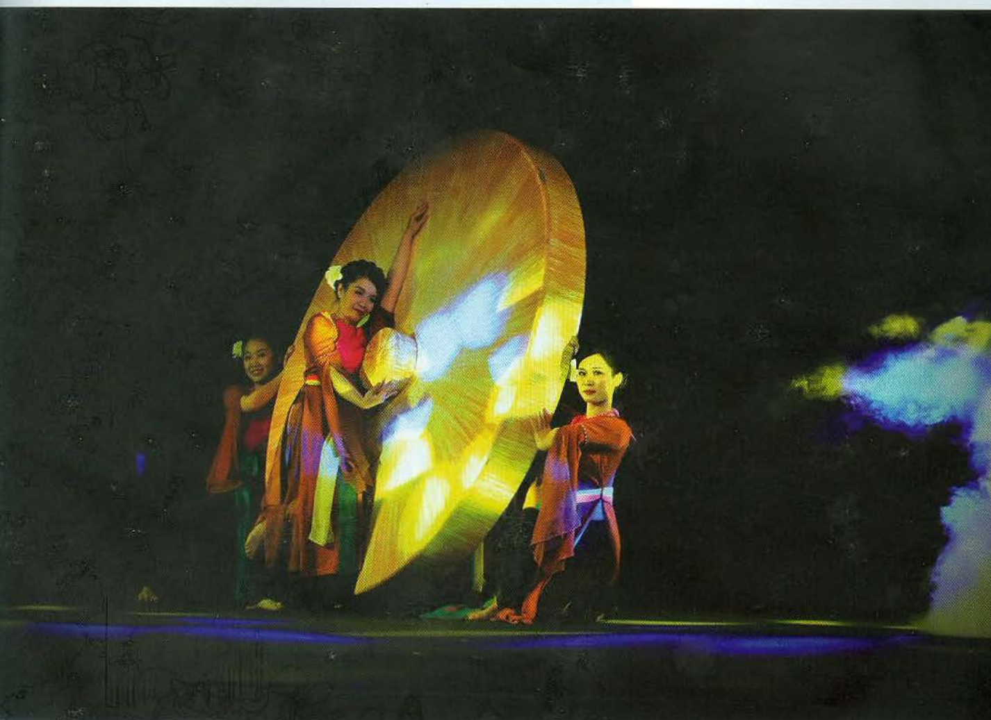
Chương trình biểu diễn phục vụ du lịch Âm vang đồng quê của Nhà hát Múa rối Việt Nam 2

truyền thống cũng như phát triển du lịch của thành phố được thể hiện thông qua nhiều chính sách ưu đãi có liên quan.