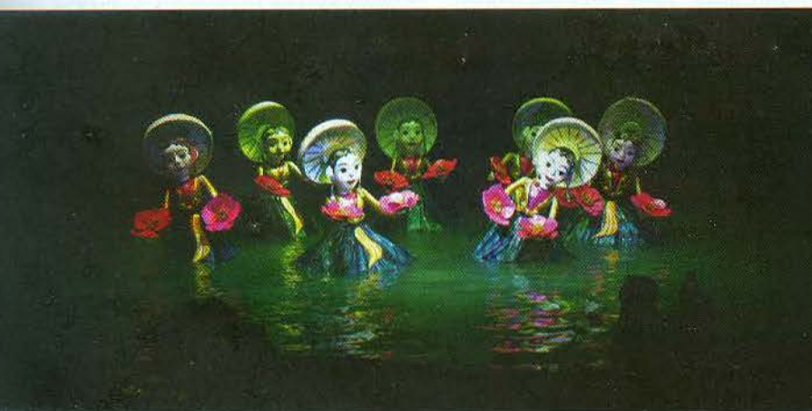
Chương trình biểu diễn phục vụ du lịch Âm vang đồng quê của Nhà hát Múa rối Việt Nam 1

thuật biểu diễn và du lịch. Đây là thị trường rất tiềm năng nhưng để khai thác được cần có một kế hoạch hợp lý và phương pháp khai thác rõ ràng. Hiện nay, ở Hà Nội, các địa điểm khai thác nở rộ mang tính chất tự phát là chính. Các sản phẩm dàn dựng phần lớn chưa đáp ứng được khả năng