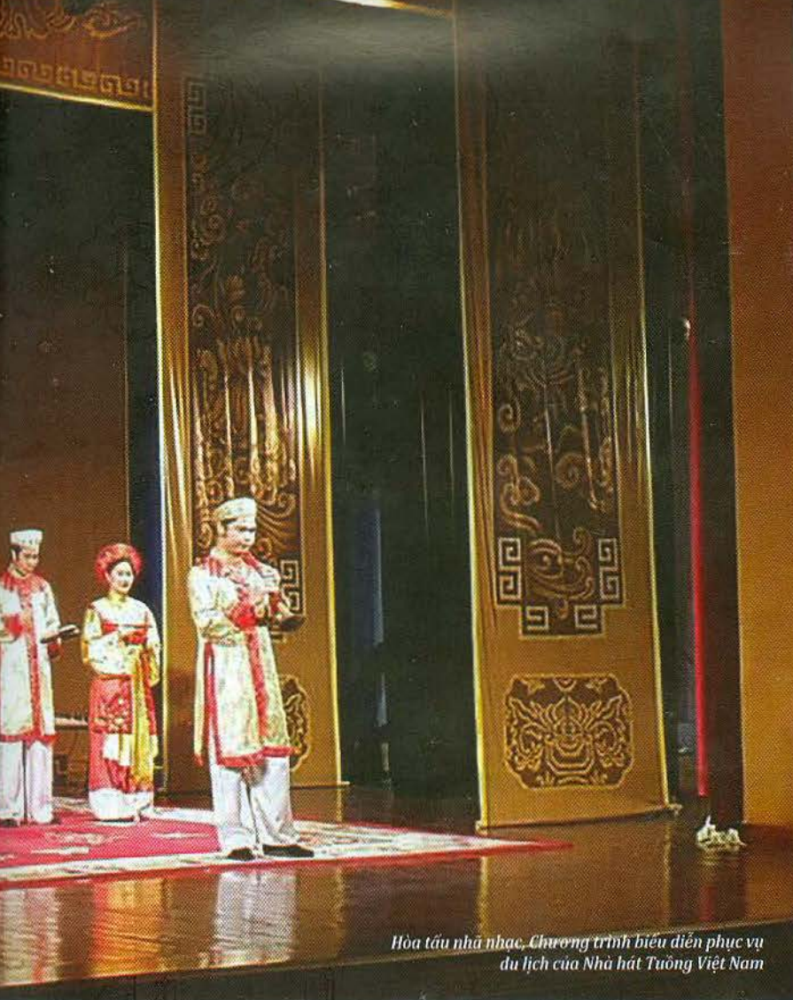
Hòa tấu nhã nhạc. Chương trình biểu diễn phục vụ du lịch của Nhà hát Tuồng Việt Nam

nghệ thuật biểu diễn truyền thống chưa được xây dựng trở thành sản phẩm chính trong tour du lịch nên công tác quảng bá cho loại hình này còn hạn chế.