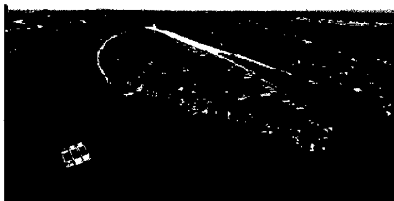
Cồn Quy nằm dọc theo dòng sông Tiền

Thực hiện mục tiêu phát triển du lịch thành ngành kinh tế mũi nhọn, tỉnh Bến Tre quan tâm đầu tư lĩnh vực du lịch nông nghiệp, DLCĐ bền vững, khai thác hiệu quả tài nguyên bản địa; xây dựng và phát triển các sản phẩm du lịch nông nghiệp, DLCĐ có trọng tâm, trọng điểm, theo hướng chuyên nghiệp, chất lượng, hiệu quả. Riêng đối với cồn Quy, Quy hoạch tổng thể phát triển Du lịch tỉnh Bến Tre đến năm 2015 và tầm nhìn đến năm 2020 đã định hướng việc phát triển các mô hình du lịch sinh thái, nghỉ dưỡng tại đây. Nghị quyết số 12/2019/NQ-HĐND của HĐND tỉnh Bến Tre quy định một số chính sách hỗ trợ kinh phí khuyến khích phát triển DLCĐ trên địa bàn tỉnh Bến Tre đã góp phần khuyến khích tạo động lực để cộng đồng người dân nâng cao chất lượng dịch vụ phục vụ khách du lịch. Theo đó, TP. Bến Tre đã vận động 6 hộ gia đình Ba Danh, Mười Nở, Hạ Thảo, Nguyệt Quế, Xóm Dừa Nước và Thanh Xuân trên địa bàn cồn Quy nhận kinh phí hỗ trợ từ 30 - 50 triệu đồng/cơ sở để đầu tư mua sắm trang thiết bị phục vụ cho DLCĐ. Đến nay, loại hình DLCĐ tại cồn Quy đã không chỉ tạo thêm một điểm đến cho ngành Du lịch Bến Tre mà còn góp phần cải thiện đời sống người dân trên chính mảnh đất quê hương.