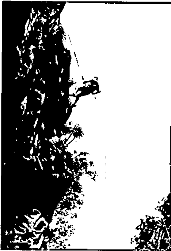
Tham gia tour leo núi.

"connect to connect" ở một thung lũng nhỏ. Không sóng điện thoại, chỉ có suối nước róc rách, có bếp củi lép lép bắn các tia hoa trong đêm lửa trại thơm mùi gà nướng, nếp lam... Những dạng glamping tour này thực chất có tính healing rất nhẹ nhàng và hiệu quả mà có thể chính các thành viên tham gia không nhận ra. Chỉ là thấy đi về thì khỏe hơn, vui hơn, hào hứng với ngày mới hơn. Nắng hay mưa cũng đều thấy gió trời và mùi lá cây lan tỏa, hương hoa lá cây thuốc khiết có thể hít căng lồng ngực, chỉ cần nhắm hờ mắt đã thấy dễ chịu vô cùng. Đó chính thuốc chữa lành mọi chứng khó thở, mất ngủ, đau nửa đầu, mỏi mệt, căng thẳng sau một thời gian quá dài thiếu tương tác với thiên nhiên.