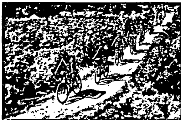
Du khách đạp xe trên con đường đầy hoa lá.