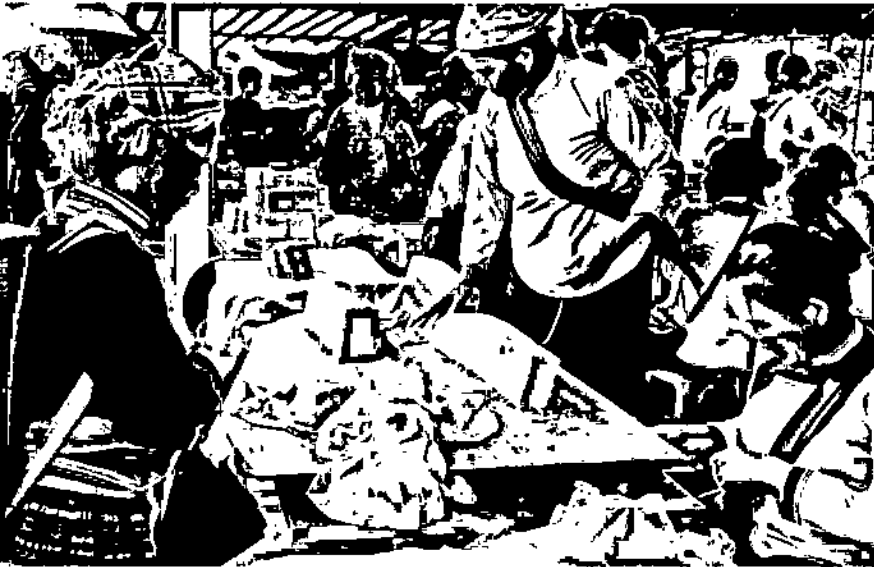
Chợ phiên San Thàng, thành phố Lai Châu.