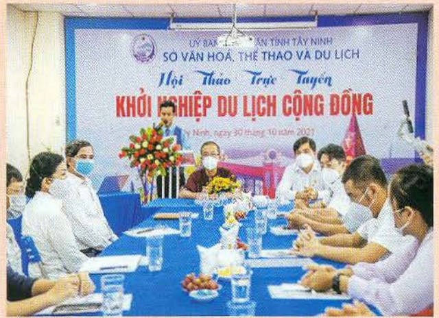
Hội thảo “Khởi nghiệp du lịch cộng đồng” tại Tây Ninh.