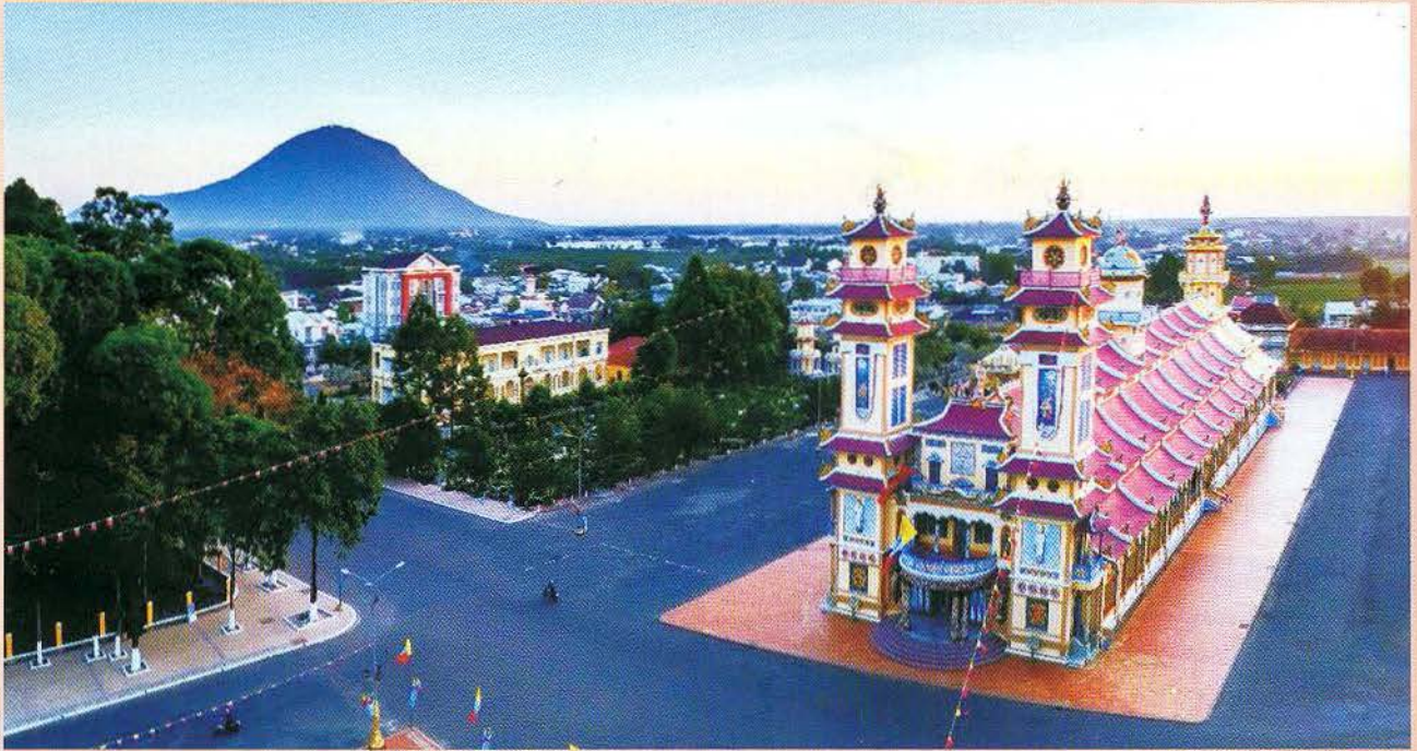
Núi Bà Đen và Tòa Thánh Cao Đài.

Nam Á cung cấp nước tưới cho hàng triệu hecta đất nông nghiệp ở tỉnh Tây Ninh và các tỉnh lân cận trong vùng. Tây Ninh được mệnh danh là vùng đất thánh với Tòa Thánh Cao Đài là trung tâm của Đạo Cao Đài. Nơi đây cũng được thiên nhiên ban tặng cho Núi Bà Đen, ngọn núi cao nhất Nam Bộ với khí hậu mát mẻ quanh năm được ví là Đà Lạt của Đông Nam Bộ. Bên cạnh khai thác và sử dụng, Tây Ninh cũng bảo tồn các di sản, đặc biệt là các di sản văn hóa phi vật thể như Đờn ca tài tử Nam Bộ... bên cạnh việc