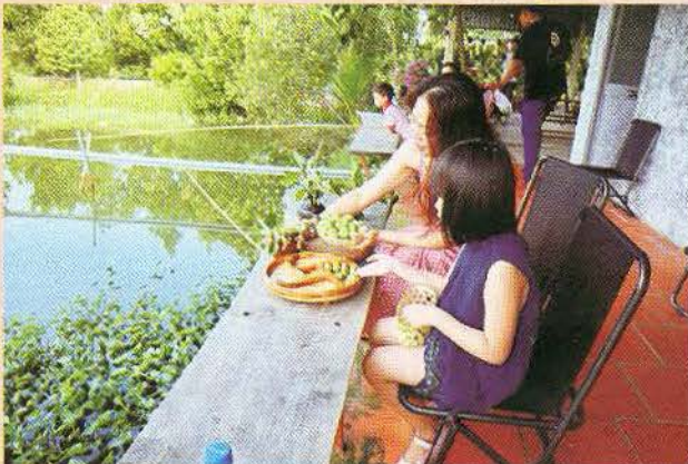
Một mô hình farmstay tại Tây Ninh.

Hiện trên cả nước rất đa dạng các mô hình