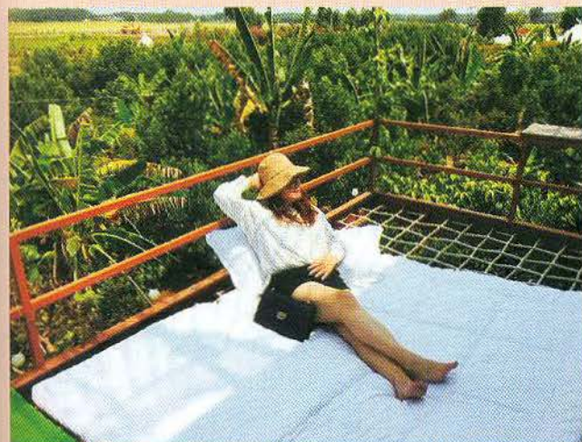
Một góc thư giãn trong farmstay ở Tây Ninh.

Nhận thấy tình hình đó, ngày 30/10/2021 Trung tâm Thông tin xúc tiến du lịch Tây Ninh nhận được sự đồng thuận của UBND tỉnh và Sở Văn hóa, Thể thao và Du lịch đã tổ chức buổi hội thảo trực tuyến với chủ đề “Khởi nghiệp Du lịch Cộng đồng” với mong muốn sản phẩm hấp dẫn này sẽ giúp người dân ổn định cuộc sống, nâng tầm vị thế Du lịch của Tây Ninh cao thêm