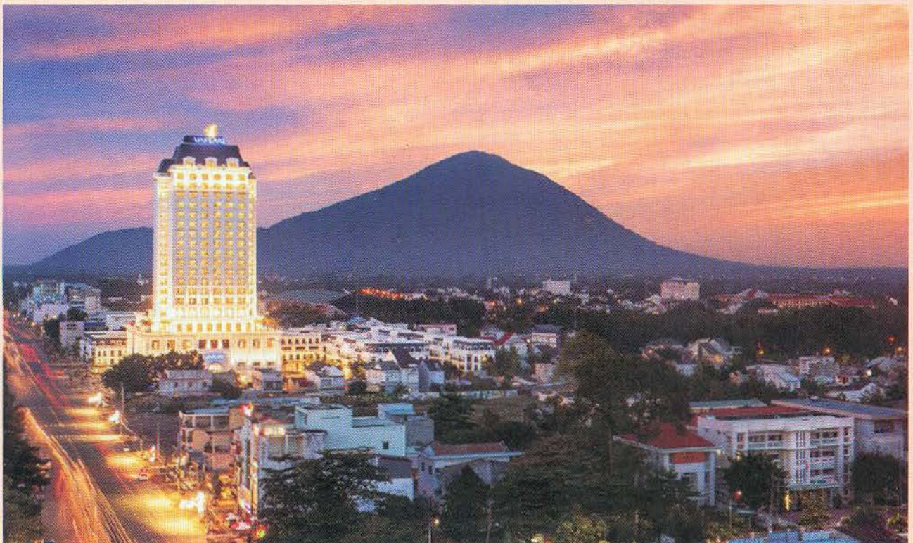
Hoàng hôn Tây Ninh

Thứ năm, phát triển và đa dạng hóa thị trường khách du lịch: Xây dựng các sản phẩm du lịch đáp ứng nhu cầu của du khách, kéo dài