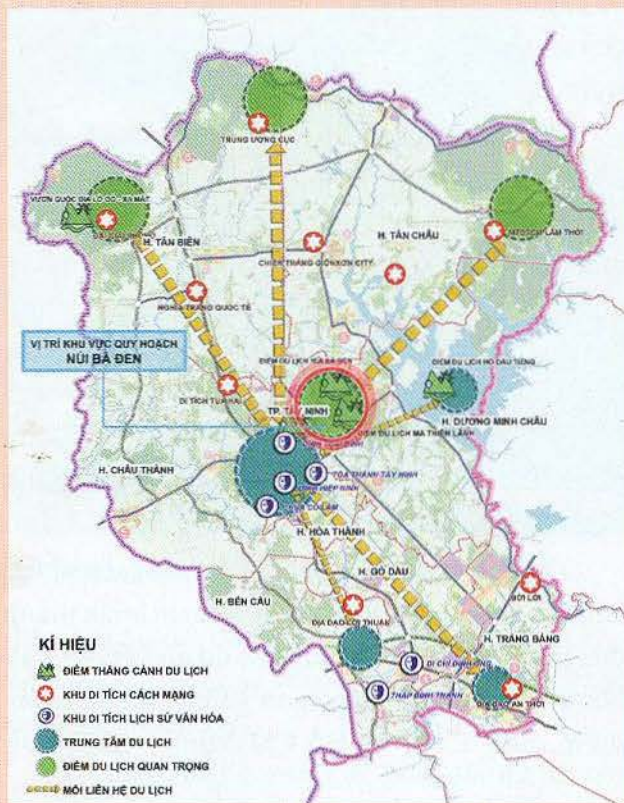
Sơ đồ định hướng phát triển du lịch vùng, tỉnh Tây Ninh

Để tiếp tục phát huy kết quả đạt được và xây dựng kế hoạch phát triển du lịch tỉnh Tây Ninh đến năm 2025 và định hướng đến năm 2030, Tỉnh Tây Ninh đã đề ra mục tiêu: Đến năm 2025, Khu du lịch Núi Bà Đen đạt tiêu chuẩn khu du lịch cấp quốc gia, trở thành khu du lịch đẳng cấp của khu vực và quốc gia, là tâm điểm dẫn dắt, kết nối lan toả du lịch địa phương và khu vực Đông Nam bộ; doanh thu du lịch giai đoạn 2021-