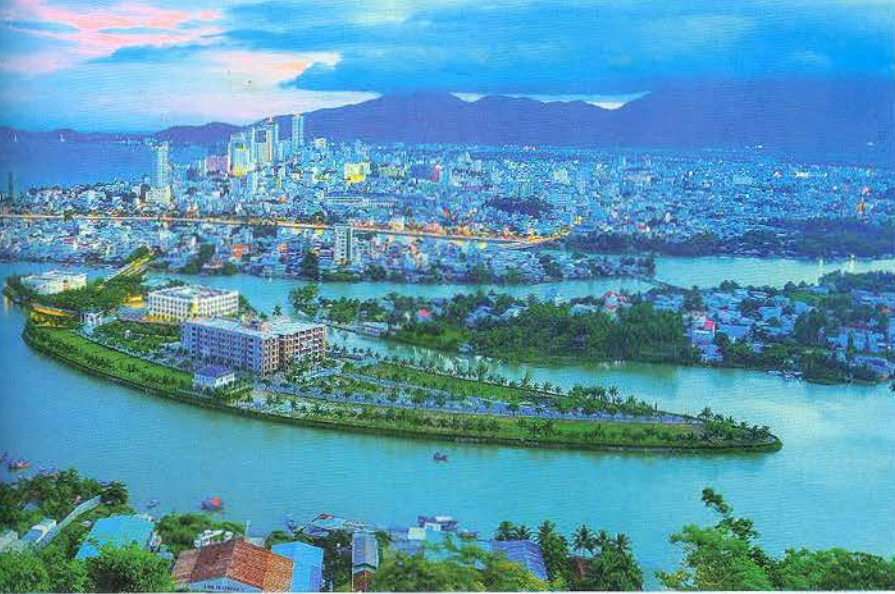
Phố biển Nha Trang.

với chương trình kích cầu chủ đề “Người Khánh Hòa đi du lịch Khánh Hòa” từ ngày 01/10, đón khách du lịch ngoại tỉnh với các chương trình kích cầu chủ đề “Người Việt Nam đi du lịch Việt Nam”, “Du lịch Việt Nam an toàn”, “Nha Trang Biển gọi” từ ngày 16/10 và đón khách du lịch quốc tế từ đầu tháng 11/2021. Song song với đó là các hoạt động truyền thông, xúc tiến quảng bá về du lịch Nha Trang – Khánh Hòa được triển khai sâu rộng, đa dạng, liên tục đến các thị trường du lịch trọng điểm trong nước và quốc tế. Nhờ đó, chỉ trong 3 tháng cuối năm 2021, lượng khách du lịch đến với Khánh Hòa đạt hơn 122.000 lượt, doanh thu du lịch ước đạt hơn 570 tỷ đồng. Trong đó, khách du lịch quốc tế có “hộ chiếu vắc xin” đạt hơn 3.100 lượt với 14 chuyến bay đến từ các nước Nga, Hàn Quốc, Nhật Bản, Malaysia. Du lịch Khánh Hòa trở thành điểm sáng trong bức tranh của Du lịch Việt Nam.