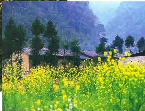
Mùa hoa cải.