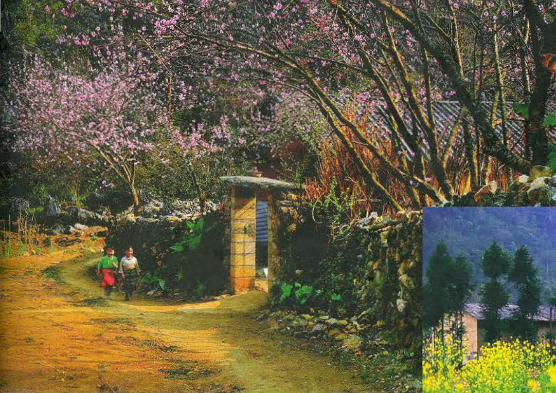
Mùa xuân trên cao nguyên đá.