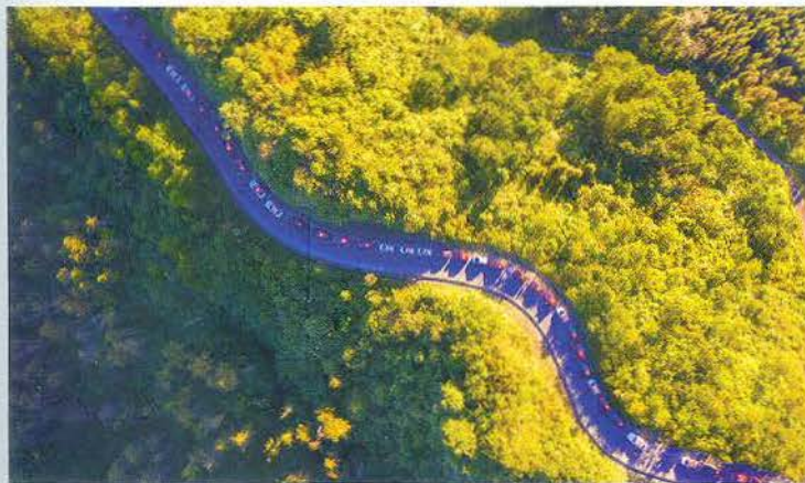
Chinh phục, khám phá Hà Giang.