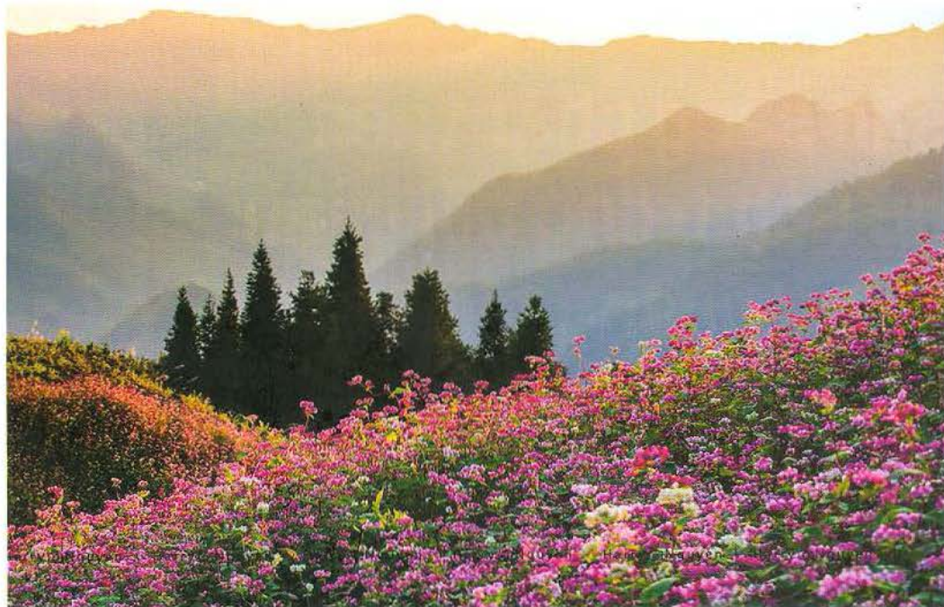
Mùa hoa tam giác mạch.