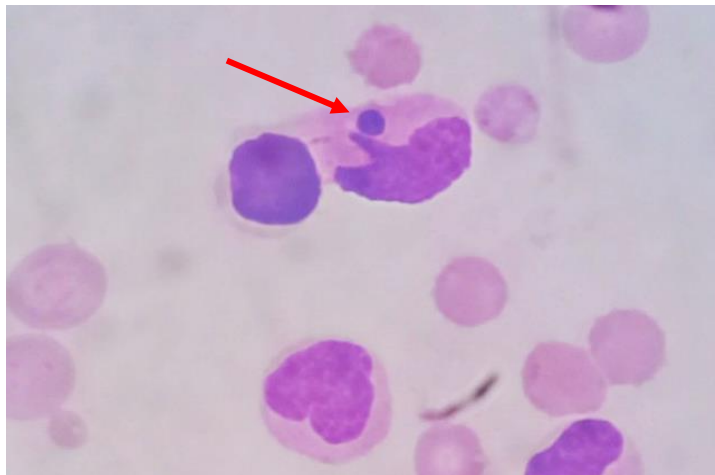
Hình 2. Phôi dâu của E. canis trong bạch cầu đơn nhân (mũi tên đỏ) dưới kính hiển vi 100X

Thể vùi nội bào trong tế bào đơn nhân (tế bào lympho, bạch cầu đơn nhân và đại thực bào) (Hình 2) được coi là tương thích với nhiễm trùng E. canis : bạch cầu đơn nhân có tế bào chất màu hồng nhạt với nhân màu tím đến xanh tím, vi khuẩn bắt màu xanh nhạt đến xanh đậm (Vargas-Hernández et al., 2012).