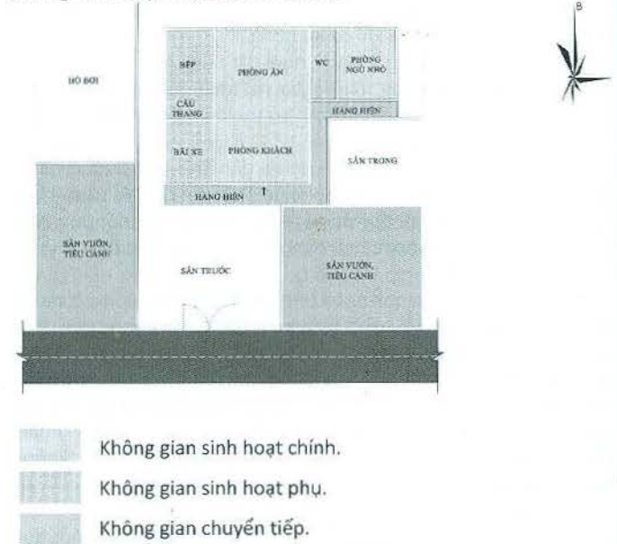
Hình 1. Sơ đồ định hướng chung bố cục nhà biệt thự vườn

Nhà biệt thự vườn là loại hình nhà ở được xây dựng trên một khoảng đất có diện tích lớn, được thiết kế với cảnh quan là những vườn cây, tiểu cảnh, hay đài phun nước, bể cá xung quanh, là sự hòa hợp giữa kiến trúc và thiên nhiên. Biệt thự vườn có diện tích sân vườn lớn, mật độ xây dựng thấp và thường được xây dựng ở những vùng quê yên tĩnh, hay ở những vùng ngoại thành, nơi có phong cảnh đẹp, mật độ dân số thấp.