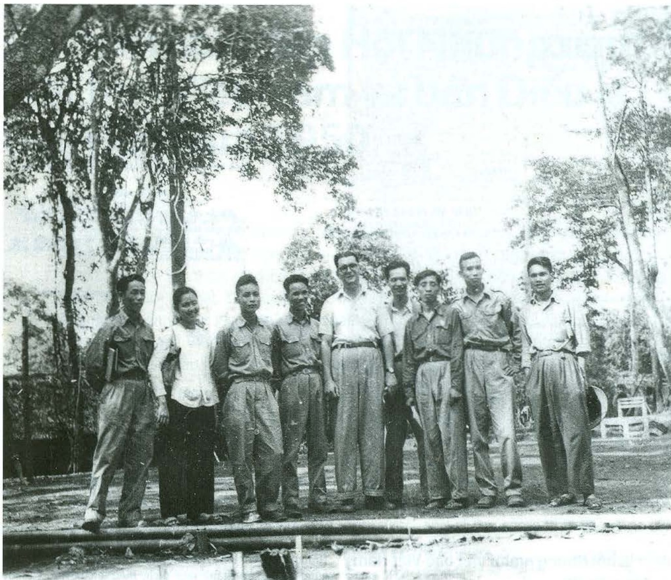
Đại diện Ban Chấp hành Hội Những người viết báo Việt Nam khóa I với Nhà báo Léo Figuères, Ủy viên dự khuyết Trung ương Đảng Cộng sản Pháp, Chủ nhiệm báo Avant garde (Tiên phong) tại Thái Nguyên, tháng 8/1950.