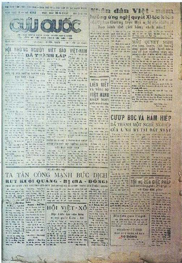
Báo Cứu Quốc ra ngày 26/6/1950 đưa tin sự kiện thành lập Hội những người viết báo Việt Nam