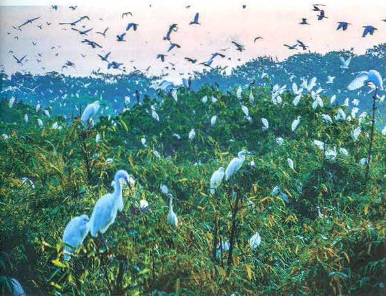
Vườn cò Bằng Lăng

BÊN CẠNH VIỆC TĂNG CƯỜNG LIÊN KẾT, HỢP TÁC PHÁT TRIỂN DU LỊCH VỚI CÁC ĐỊA PHƯƠNG TRONG KHU VỰC ĐỒNG BẰNG SÔNG CỬU LONG, HÌNH THÀNH CÁC TUYẾN DU LỊCH HẤP DẪN..., CẦN THƠ ĐANG ĐẨY MẠNH PHÁT TRIỂN DU LỊCH CỘNG ĐỒNG NHẪM KHAI THÁC ĐIỀU KIỆN TỰ NHIÊN, NÂNG CAO Ý THỨC TRÁCH NHIỆM BẢO VỆ MÔI TRƯỜNG, HƯỚNG TỚI PHÁT TRIỂN BỀN VỮNG.