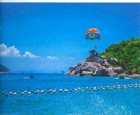
Cù Lao Chàm sở hữu nguồn tài nguyên phong phú.

T heo Tổ chức Du lịch thế giới (UNWTO), nhu cầu trải nghiệm của khách du lịch quốc tế sẽ hướng tới những giá trị mới được thiết lập trên giá trị văn hóa truyền thống (tính độc đáo, nguyên bản), giá trị tự nhiên (tính nguyên sơ, hoang dã), giá trị sáng tạo và công nghệ cao (tính hiện đại, tiện nghi); sẽ có sự dịch chuyển từ du lịch đại chúng sang các loại hình du lịch sinh thái, du lịch dựa vào cộng đồng trong thời gian tới. Mặt khác, Nghị quyết số 36-NQ/TW về “Chiến lược phát triển bền vững kinh tế biển Việt Nam đến năm 2030, tầm nhìn đến năm 2045” coi du lịch và dịch vụ biển là ưu tiên số một trong phát triển kinh tế biển Việt Nam. Là khu dự trữ sinh quyển thế giới (DTSQTG), Cù Lao Chàm được các tổ chức quốc tế quan tâm, trao đổi hợp tác và nghiên cứu giáo dục. Đây là cơ hội để giới thiệu, quảng bá hình ảnh khu DTSQTG đến đông đảo bạn bè quốc tế cũng như