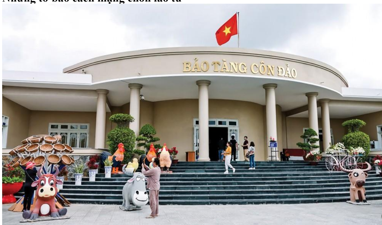
Bảo tàng Côn Đảo.

Tháng 4, chúng tôi có dịp về Côn Đảo, thăm lại Di tích quốc gia đặc biệt Nhà tù Côn Đảo và Bảo tàng Côn Đảo. Đi dưới những phòng giam, khám lớn, rảo bước dưới những cội bàng Côn Đảo trăm năm, lòng cảm xúc tri ân biết bao thế hệ cha ông đã hy sinh để giữ nước.