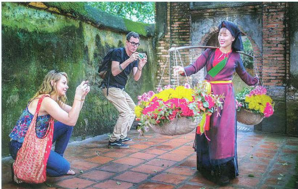
Giao lưu giữa người dân bản địa và du khách.