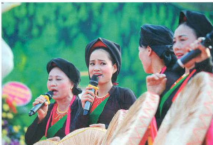
Nét duyên quan họ Bắc Giang.

cộng đồng chưa được đầu tư, nâng cấp. Việc tổ chức quản lý, điều hành các dịch vụ chưa chuyên nghiệp. Bên cạnh đó, sản phẩm du lịch và các dịch vụ tại các khu, điểm du lịch và du lịch cộng đồng chưa phong phú, hấp dẫn; nguồn vốn của nhà nước và của cộng đồng dân cư đầu tư cho phát triển du lịch cộng đồng còn hạn chế.