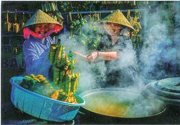
Hương vị quê hương.