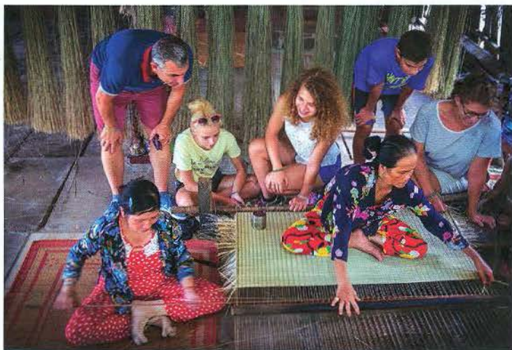
Du khách quốc tế tìm hiểu nghề dệt chiếu ở Bến Tre.

Từ các mô hình nêu trên có thể thấy lực lượng nông dân đóng vai trò chính - là chủ thể trong các hoạt động và tạo được hiệu quả trong phát triển kinh tế du lịch nói riêng và kinh tế - xã hội nói chung.