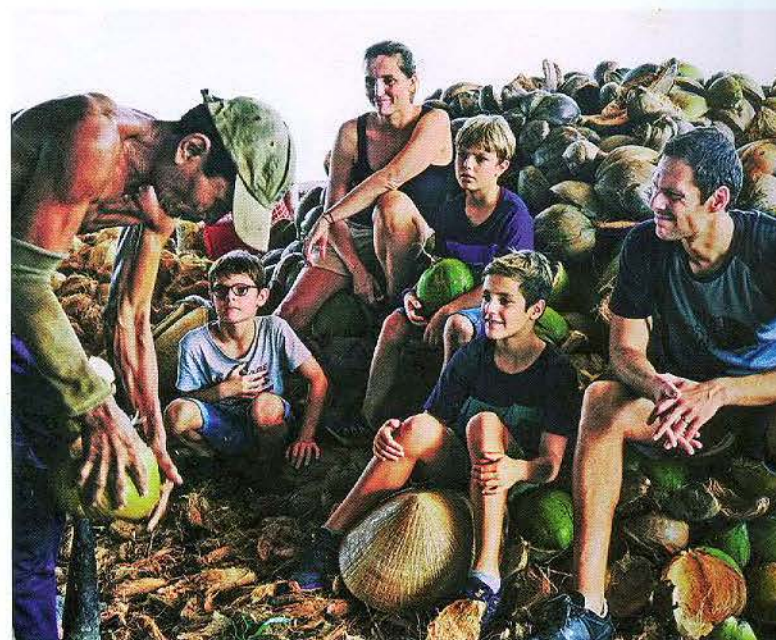
Khám phá đặc sản xứ dừa Bến Tre.

Tham gia phát triển du lịch trên nền tảng sản xuất nông nghiệp còn phải kể đến đến vai trò của các hợp tác xã (HTX) nông nghiệp trên địa bàn tỉnh như: HTX Nông nghiệp Định Thủy (huyện Mỏ Cày Nam), HTX Thạnh Phong (huyện Thạnh Phú), HTX Du lịch nông nghiệp Bến Tre (thành phố Bến Tre), HTX Bưởi da xanh Giồng Trôm (huyện Giồng Trôm)... Trong đó, lực lượng nông dân luôn đóng vai trò là chủ thể chính, mang lại hiệu quả kinh tế ruộng - vườn rất cao, giải quyết công ăn việc làm, đóng góp vào sự phát triển kinh tế - xã hội của địa phương.