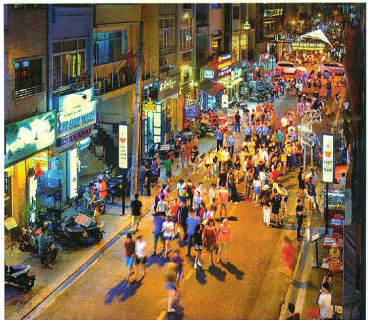
Trên phố đi bộ Bùi Viện, Thành phố Hồ Chí Minh.

lượng khách nội địa đã sử dụng dịch vụ tại các khách sạn, khu du lịch cao cấp từ 3 đến 5 sao trong năm 2009 vẫn tăng cao, góp phần tăng thu nhập du lịch cả nước, bù lại cho lượng khách quốc tế giảm 10%. Bên cạnh đó, Chương trình còn thành công khi giúp các doanh nghiệp lữ hành, khách sạn, dịch vụ liên kết chặt chẽ với nhau hơn, chung tay xây dựng các tour, cùng chia sẻ quyền lợi vì lợi ích quốc gia. Bài học của hai lần kích cầu du