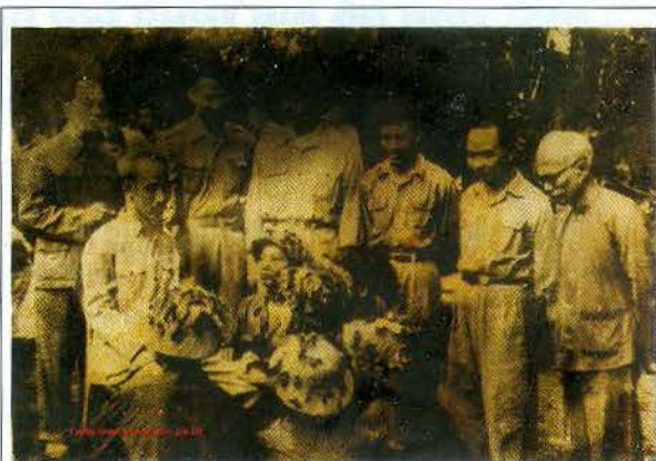
Chủ tịch Hồ Chí Minh và các đồng chí lãnh đạo nói chuyện thân mật với các chiến sĩ thi đua trong quân đội tại Đại hội Anh hùng Chiến sĩ thi đua toàn quốc năm 1952

Cũng tại Lễ khai mạc Đại Hội Chủ tịch Hồ Chí Minh đã có bài huấn thị về thi đua ái quốc. Trong bài huấn thị này, Người nói về mục đích thi đua, về nội dung thi đua, về mức thi đua, về ý nghĩa của việc thi đua.