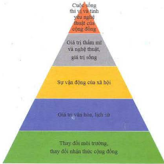
Hình 1: Thang giá trị NTCC đem lại cho điểm đến

của NTCC có lẽ là điều khiến nó trở nên lôi cuốn với người xem, thu hút khách tham quan và du lịch. Trung bình có khoảng 55 triệu lượt khách trải nghiệm tận mắt NTCC mỗi ngày một cách miễn phí, gấp rất nhiều lần so với số lượng khách đến tham quan tại các phòng trưng bày nghệ thuật, bảo tàng và nhà hát (theo https://norfolkarts.net/about-norfolk-public-art/ ).