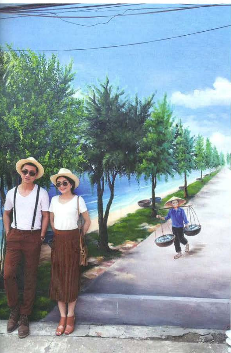
Những công trình nghệ thuật công cộng lôi cuốn khách tham quan, du lịch

TRONG MỘT XÃ HỘI PHÁT TRIỂN, NGHỆ THUẬT NÓI CHUNG VÀ NGHỆ THUẬT CÔNG CỘNG (NTCC) NÓI RIÊNG ĐÃ PHÁ VỠ NHỮNG RÀO CẢN NGÔN NGỮ, VĂN HÓA, SẮC TỘC, KINH TẾ - CHÍNH TRỊ ĐỂ CON NGƯỜI XÍCH LẠI GẮN NHAU, ĐỂ DU KHÁCH PHẦN NÀO CẢM NHẬN ĐƯỢC NHỮNG GIÁ TRỊ TINH THẦN CỦA CỘNG ĐỒNG NƠI ĐẾN. NTCC KHÔNG CHỈ LÀ TIỀM NĂNG TO LỚN CHO THU HÚT DU KHÁCH MÀ HƠN THẾ NỮA, NTCC ĐÃ VÀ ĐANG NÂNG TẦM GIÁ TRỊ ĐIỂM ĐẾN.