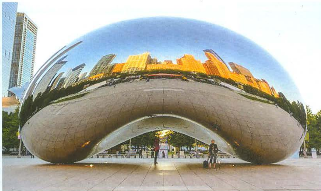
Cổng Máy ở Chicago - Mỹ.

Thực tế, NTCC đã chứng minh khả năng tiếp thêm sinh lực cho không gian công cộng, nâng cao nhận thức, biến nơi con người sống, làm việc và vui chơi trở thành một không gian thân thiện, tươi đẹp và có tính tương tác cao với cộng đồng, có sức hút với du khách tham quan.