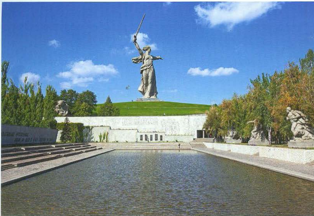
Tượng đài Mẹ Tổ quốc tại Volgograd, Nga (kỷ niệm trận chiến Stalingrad trong Thế chiến thứ 2).

Không giống như những loại hình nghệ thuật khác, NTCC không đơn thuần chỉ là “sản phẩm tinh thần” của một hay nhóm nghệ sĩ, mà sự ra đời và tồn tại của nó còn được quyết định phần lớn bởi số đông công chúng. Sự đa dạng trong loại hình, cách biểu đạt, sự phóng khoáng và tự do sáng tạo, tính thẩm mỹ và sự “gần gũi” với công chúng là những nét đặc trưng của NTCC, khiến nó trở nên lôi cuốn và thu hút với đông đảo khách tham quan, du lịch.