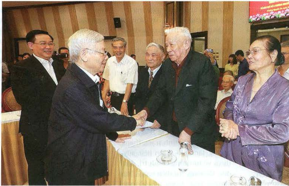
Đảng và Nhà nước ta gắn bó chặt chẽ với nhân dân, phục vụ nhân dân và chịu sự giám sát của nhân dân (Trong ảnh: Tổng Bí thư Nguyễn Phú Trọng với cử tri Tổ dân phố số 8, phường Nguyễn Du tại Hội nghị lấy ý kiến nhận xét và tín nhiệm cử tri nơi cư trú đối với người ứng cử đại biểu Quốc hội khóa XV, nhiệm kỳ 2021-2026 (tháng 3-2021)).

lý luận đó chỉ đặt nền móng cho môn khoa học mà những người xã hội chủ nghĩa cần phải phát triển hơn nữa về mọi mặt, nếu họ không muốn trở thành lạc hậu đối với cuộc sống” (1) .