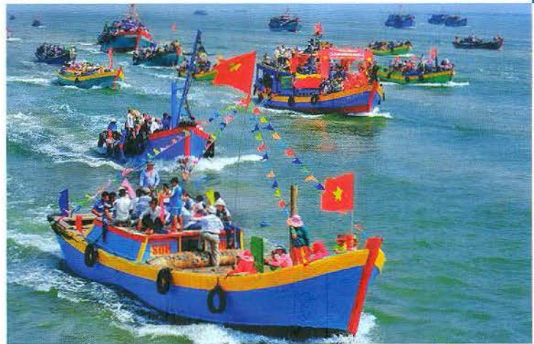
Lễ hội Nghinh Ông Vàm Láng diễn ra nhằm cầu mong mưa thuận, gió hòa.

Ở VÙNG BIỂN VÀM LÁNG (HUYỆN GÒ CÔNG ĐÔNG) CỦA TỈNH TIỀN GIANG, HÀNG NĂM VÀO NGÀY 9, 10 VÀ 11 THÁNG 3 (ÂM LỊCH), NGƯ DÂN KHẮP NƠI TẬP TRUNG VỀ TỔ CHỨC LỄ HỘI NGHINH ÔNG VỚI NHIỀU NÉT VĂN HÓA ĐẶC SẮC. NGÀY NAY, LỄ HỘI NÀY CÒN GÓP PHẦN PHÁT TRIỂN KINH TẾ, VĂN HÓA VÀ XÃ HỘI CỦA ĐỊA PHƯƠNG.