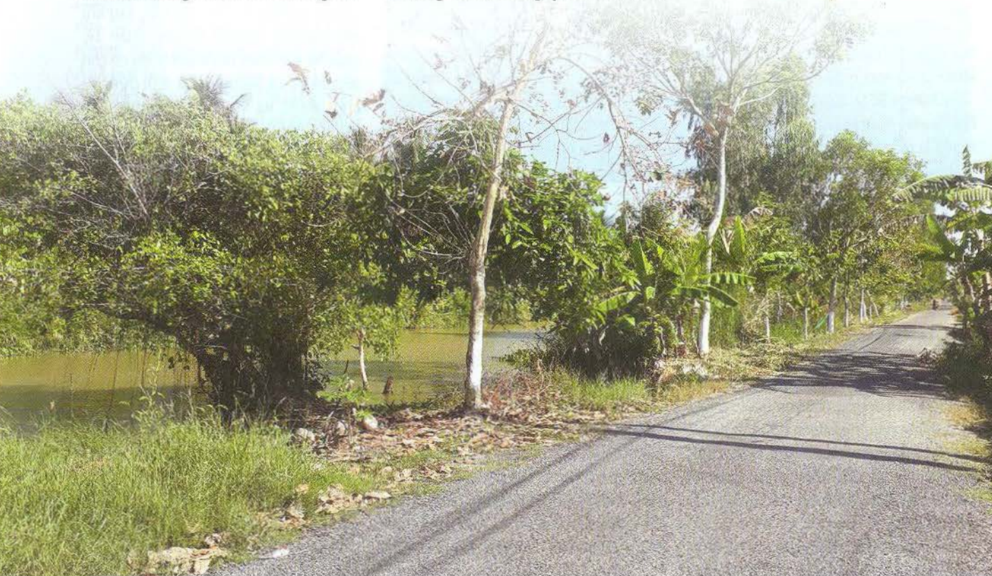
Con đường Kênh Ngang ở Lung Tràm, nơi Bác Ba Phi có nhiều năm gắn bó từ thời trai trẻ cho đến lúc cuối đời

Năm 2018, UBND huyện Trần Văn Thời kết hợp với Nhà xuất bản Văn hóa văn nghệ đã cho sưu tầm các truyện tiếu lâm của bác Ba Phi, những bài viết, nghiên cứu về cuộc đời - tác phẩm của bác Ba và in thành sách, phát hành rộng rãi ở địa phương và cả nước. Bên cạnh đó, UBND huyện còn lên kế hoạch xây dựng Điểm du lịch Di tích bác Ba Phi tại Lung Tràm với diện tích gần 70.000 m 2 , trong đó có một phần là do gia đình bác Ba Phi hiến tặng đất để xây dựng. Tương lai nơi đây sẽ trở thành một địa điểm du lịch hấp dẫn với những yếu tố gắn liền với cuộc đời và di sản của bác Ba Phi. ■