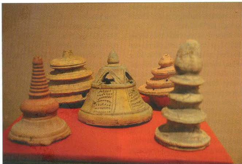
Nắp đậy nôi, hũ thế kỷ V-VII

Gò Cây Thị cách thị trấn Ốc Eo chưa đến 10km. Trước khi vào gò Cây