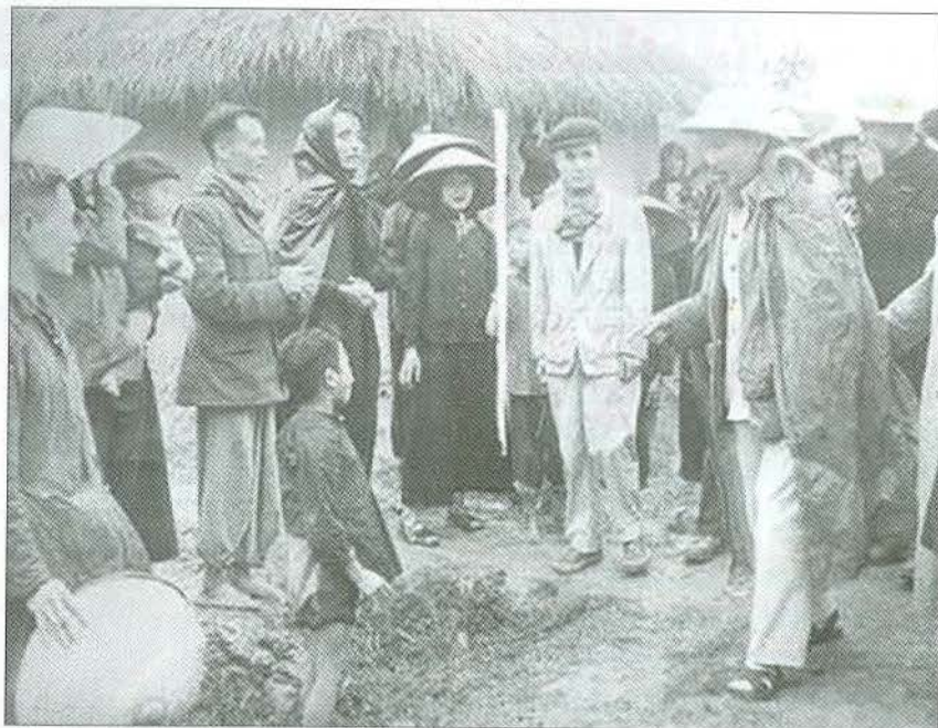
Phong cách làm việc tận tụy, trách nhiệm và khoa học của Chủ tịch Hồ Chí Minh là tấm gương sáng cho cán bộ, Đảng viên noi theo

Học tập và làm theo phong cách làm việc của Chủ tịch Hồ Chí Minh đòi hỏi cán bộ lãnh đạo, cán bộ quản lý nói riêng và cán bộ nói chung phải không ngừng tu dưỡng, rèn luyện đạo đức cách mạng, kiên quyết chống chủ nghĩa cá nhân, làm việc miệt mài, tận tâm, tận tụy với công việc. Trong làm việc, người cán bộ phải