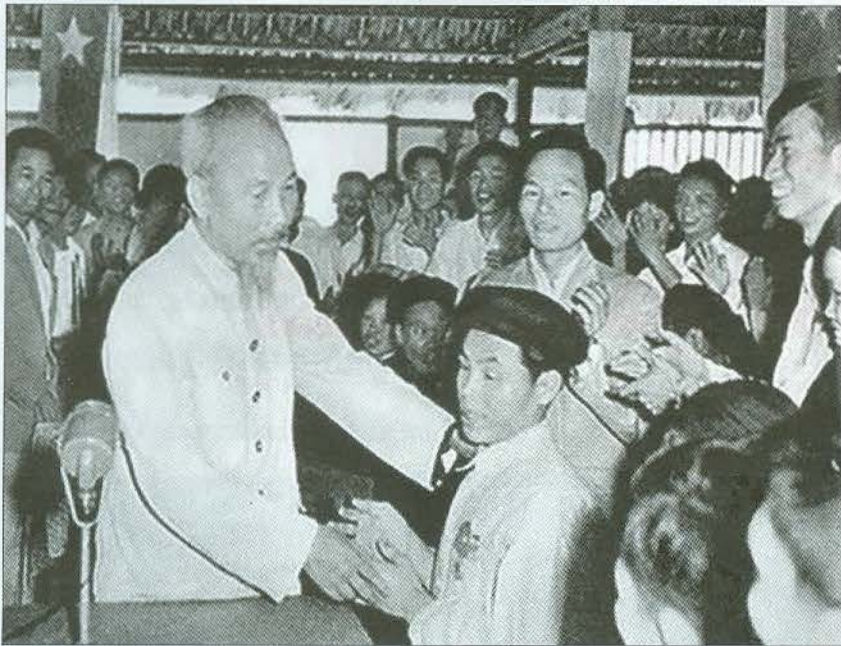
Bác Hồ thăm hỏi chiến sĩ thi đua Phạm Trung Pôn bị mù hai mắt nhưng đã có sáng kiến cải tiến nông cụ

đã nhiều lần phê bình bệnh hữu danh vô thực ở không ít cán bộ: “Làm việc không thiết thực... Làm cho có chuyện, làm lấy rồi. Làm được ít suất ra nhiều, để làm một bản báo cáo cho oai, nhưng xét kỹ lại thì rỗng tuếch... Thế là đối trá với Đảng, có tội với Đảng. Làm việc không thiết thực, báo cáo không thật thà, cũng là một bệnh rất nguy hiểm” [1, tr.256-257]. Chủ tịch Hồ Chí Minh đặc biệt lưu ý, đối với nhân dân không thể lý luận suông, chính trị suông, nhân dân cần trông thấy lợi ích thiết thực từ những tấm gương sáng, những việc làm thiết thực của cán bộ.