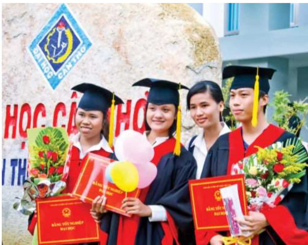
Sinh viên Trường ĐHCT trong lễ tốt nghiệp.

Sau ngày 30-4-1975, Viện ĐHCT đổi tên thành Trường ĐHCT. Viện ĐHCT rồi Trường ĐHCT đã mạnh dạn theo đường lối giáo dục thực tiễn, đóng góp hữu hiệu những kiến thức, cùng nhân lực cho phát triển ĐBSCL và cả nước. Đặc biệt trong những năm đầu thành lập, Viện ĐHCT đã thực hiện “Chương trình Mekong” mang lại lợi ích cho cư dân ở tận thượng nguồn sông Mekong. Đây là lần đầu tiên một viện đại học tại Việt Nam đứng ra đảm trách một chương trình khảo cứu thiết thực cho vấn đề phát triển, so với các khảo cứu kinh điển của các đại học khác đương thời. Ngoài ra với việc áp dụng chế độ thi cử theo hệ thống tín chỉ, Viện ĐHCT đã đi tiên phong trong chương trình cải cách giảng dạy và thi cử ở bậc đại học nước ta thời đó.