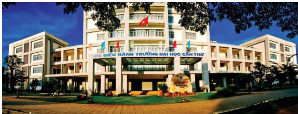
Nhà điều hành Trường ĐHCT bây giờ.

Ngày 5-4-1967, Viện ĐHCT được cho phép sử dụng một khu đất rộng 87ha nằm ở ngọn rạch Cái Khế để làm Khu Đại học II. Hiện đây là khu II, nằm trên đường 3 Tháng 2, quận Ninh Kiều.