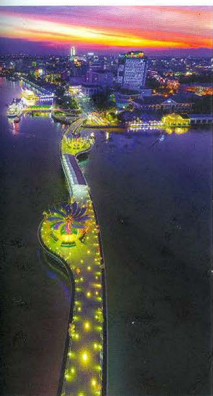
Cầu đi bộ bên bến Ninh Kiều.