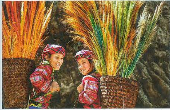
Đôi bạn.

Thành lập từ tháng 12/2015, Công viên địa chất Đăk Nông có diện tích khoảng 4.760km 2 , ranh giới trải dài trên 6 huyện, thành phố là Krông Nô, Cư Jút, Đăk Mĩ, Đăk Song, Đăk Glong và Gia Nghĩa.