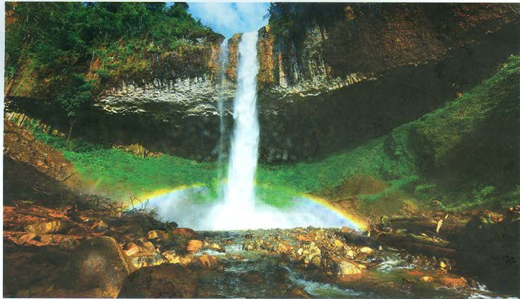
Hùng vĩ thác Liêng Nung.

Rà soát, bổ sung hoàn thiện chính sách hỗ trợ, ưu đãi đầu tư trong lĩnh vực du lịch, đồng thời cân đối nguồn lực để thực hiện, đảm bảo chính sách phải thực sự