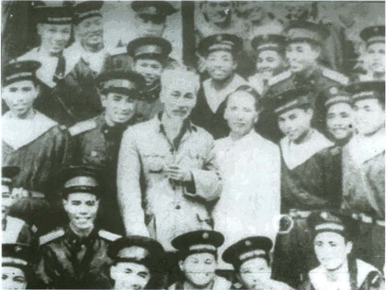
Bác Hồ chụp ảnh kỷ niệm với cán bộ, chiến sĩ Trường Huấn luyện bờ biển (sau đổi tên Trường Sĩ quan chỉ huy Kỹ thuật Hải quân, nay là Học viện Hải quân). Ảnh tư liệu

người xứng đáng thay mặt cho mình, gánh vác việc nước". Nhưng "Làm việc nước bây giờ là hy sinh, là phấn đấu, quên lợi riêng và nghĩ lợi chung. Những ai muốn làm quan cách mạng thì nhất định không nên bầu".