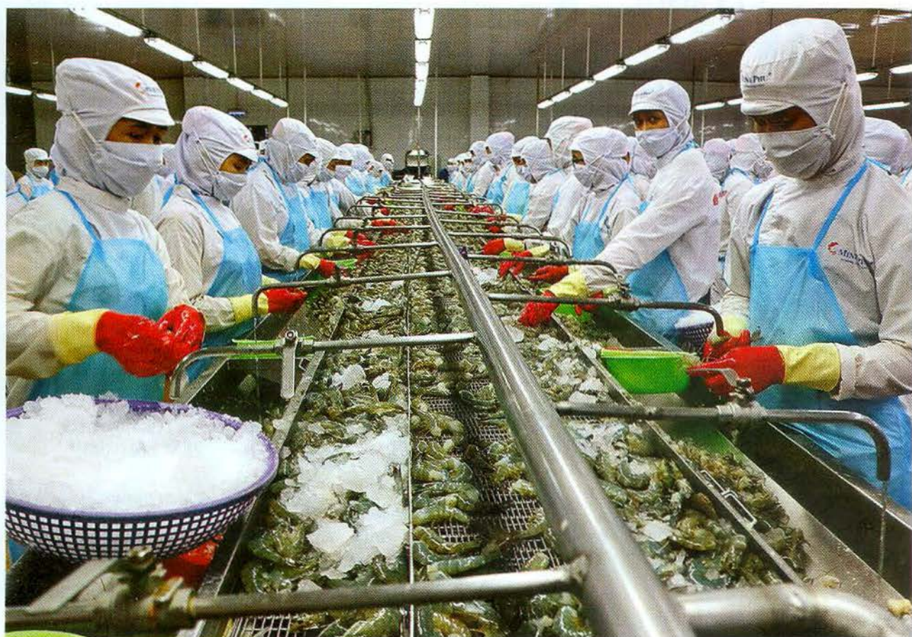
Xuất khẩu tôm của Việt Nam đang có xu hướng tăng mạnh.