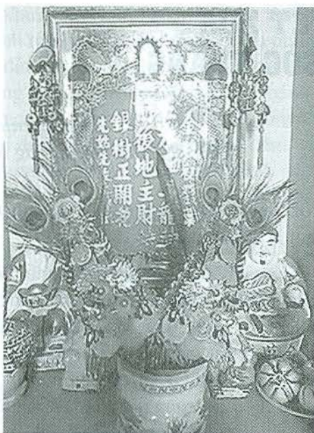
Cặp kim huôi làm cho khám thờ Thần Tài thêm rực rỡ.

con gà mái luộc với nhiều hành củ hoặc hành lá bởi người Hoa gọi hành là thông , gà gọi là kê - đồng với âm thông cát có nghĩa là tốt đẹp suốt cả năm, cùng với củ lao và cá chiên xốt chua ngọt gọi là niên niên hữu dư vì cá đồng âm với dư với mong muốn làm ăn phát đạt, cuộc sống dư dả. Mẹ tôi còn chuẩn bị lạp xương , lạp nhục hay lạp bình (thịt heo xẻ miếng phơi khô) hoặc vịt lạp để ăn trong mấy ngày Tết.