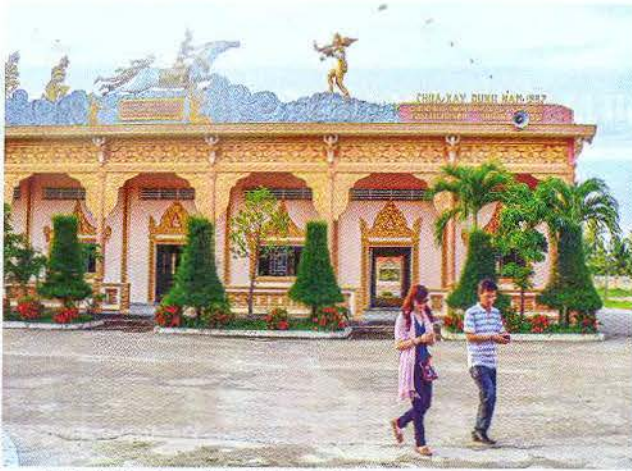
Chùa Xiêm Cán.

khai, cơ sở vật chất, hạ tầng giao thông được nâng cấp, mở rộng. Các hoạt động phục vụ, dịch vụ và du lịch từng bước được tổ chức chuyên nghiệp hơn. Nhiều sự kiện lớn về du lịch đã được tổ chức như: Tuần Văn hóa - Du lịch năm 2019; Ký kết hợp tác phát triển du lịch với thành phố Hồ Chí Minh và 13 tỉnh, thành Đồng bằng sông Cửu Long... Có nhiều sản phẩm du lịch đã thương hiệu trong khu vực và cả nước, thu hút đông đảo du khách trong và ngoài nước đến tham quan. Tổng doanh thu du lịch ước đạt gần 3.000 tỷ đồng/năm, tăng gấp 3 lần so với đầu nhiệm kỳ, đóng góp đáng kể vào tăng trưởng của tỉnh, giải quyết việc làm cho 15.000 lao động, góp phần khẳng định vị trí quan trọng của du lịch Bạc Liêu trong bản đồ du lịch khu vực Đồng bằng sông Cửu Long”.