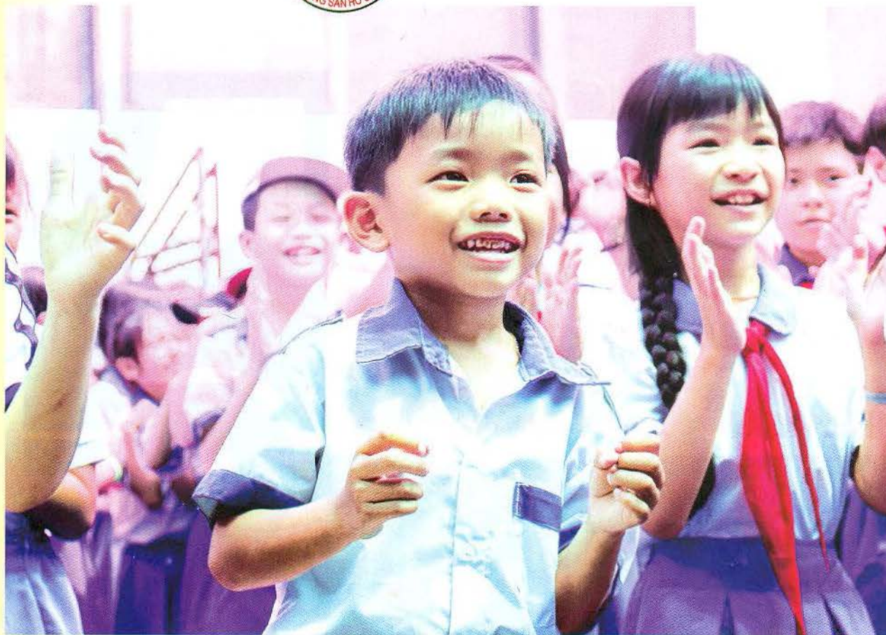
Các em học sinh Vĩnh Thạnh thích thú với các hoạt động do Ban Điều phối Chuyển xe ước mơ đem đến.

➔ Chuyển xe ước mơ đầu năm học mang đến dụng cụ học tập, nhu yếu phẩm. Trung thi thì chuyển xe mang đến những chiếc bánh trung thu, lồng đèn và những trò chơi. Còn dịp tết, chuyển xe ước mơ sẽ mang hơi ấm mùa xuân đến chia sẻ và lan tỏa cho các em.