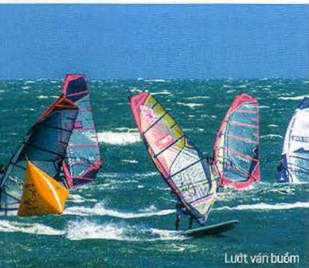
Lướt ván buồm