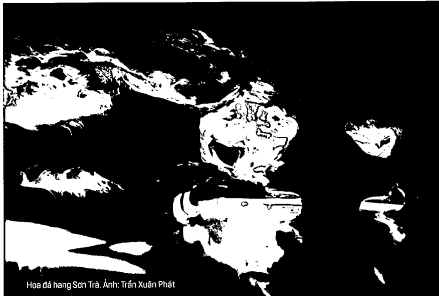
Hoa đá hang Sơn Trà.

KIÊN GIANG CÓ ĐỊA HÌNH ĐA DẠNG, BỜ BIỂN DÀI, NHIỀU SÔNG NÚI VÀ HẢI ĐẢO, NGUỒN TÀI NGUYÊN THIÊN NHIÊN PHONG PHÚ. PHÁT HUY LỢI THẾ LÀ MỘT TRONG 4 TỈNH THUỘC VÙNG KINH TẾ TRỌNG ĐIỂM ĐỒNG BẰNG SÔNG CỬU LONG, THỜI GIAN QUA TỈNH KIÊN GIANG ĐÃ TRANH THỦ CƠ CHẾ CHÍNH SÁCH, NGUỒN LỰC PHÂN BỐ CỦA TRUNG ƯƠNG ĐỂ ĐẦU TƯ VÀO HẠ TẦNG VÀ BAN HÀNH NHIỀU CHÍNH SÁCH THU HÚT CÁC THÀNH PHẦN KINH TẾ TRONG VÀ NGOÀI NƯỚC ĐẦU TƯ VÀO LĨNH VỰC DU LỊCH - LĨNH VỰC CÓ TIỀM NĂNG VÀ THẾ MẠNH CỦA TỈNH.