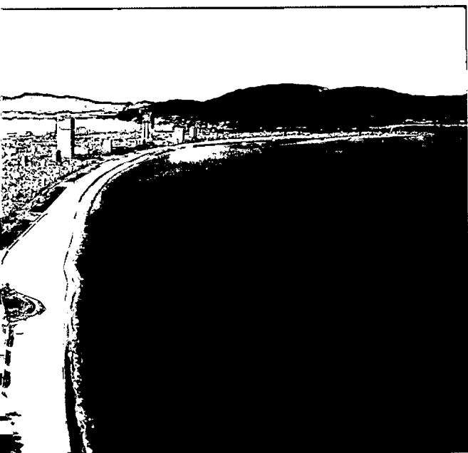
Thành phố biển Quy Nhơn. Ảnh: TTX

Song song với đó, đẩy mạnh các giải pháp truyền thông và xúc tiến quảng bá du lịch Quy Nhơn - Bình Định là điểm đến an toàn, thân thiện và hấp dẫn; tăng cường bảo đảm an toàn điểm đến; hỗ trợ doanh nghiệp, xây dựng và nâng cao chất lượng sản phẩm du lịch; liên kết phát triển du lịch; tăng cường công tác đào tạo, bồi dưỡng để nâng cao nhận thức, kỹ năng, chất lượng phục vụ nhằm phát triển nguồn nhân lực du lịch đáp ứng nhu cầu phát triển ngành Du lịch của tỉnh trong thời gian tới.