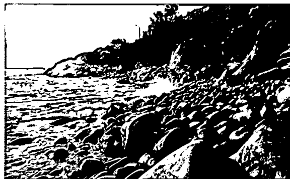
Bãi Trứng - Quy Nhơn. Ảnh: Đặng Thanh Phương

Đồng thời, vận động các doanh nghiệp kinh doanh du lịch trên địa bàn tỉnh xây dựng các chương trình kích cầu theo hướng giảm giá nhưng giữ vững chất lượng, giảm giá dịch vụ từ 10 - 40% tùy theo gói sản phẩm; xây dựng các gói sản phẩm kích cầu phù hợp và công bố cụ thể để triển khai; phối hợp với các hãng hàng không, vận tải, các