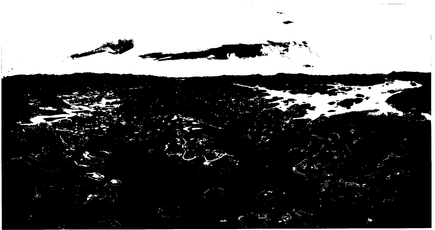
Cắm Sơn thức giấc