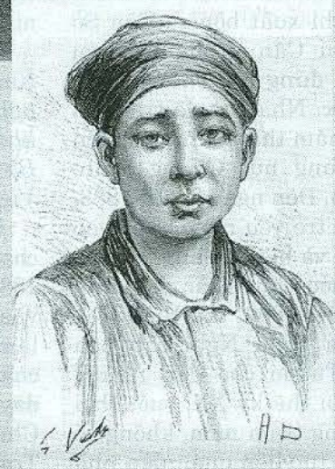
Cự hoàng Hàm Nghi nước An Nam, tù nhân của nước Pháp tại Alger (Tranh vẽ của Vuillier dựa theo bản vẽ phác của Jean Locquart) (tr. 119).

Ông vua bị bắt không tiếp khách đến thăm và những gì