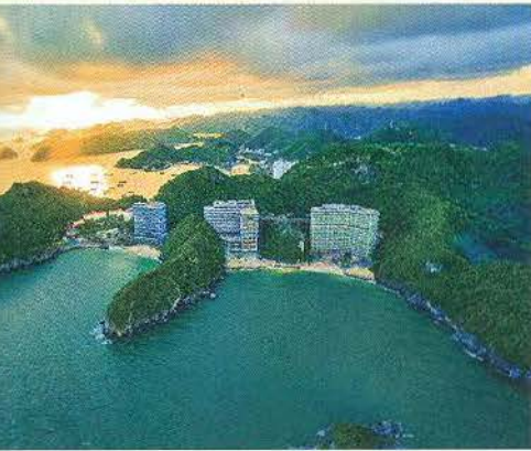
Resort tại vịnh biển đẹp nhất thế giới