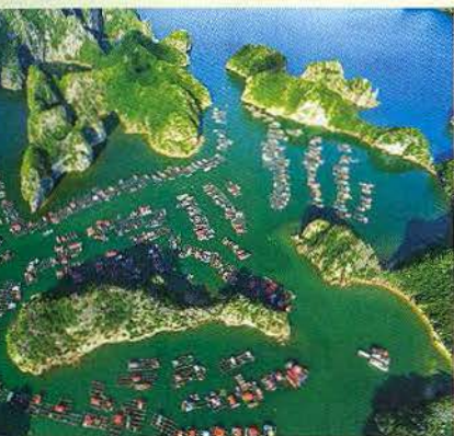
Những ngôi nhà nổi kết lại san sát với nhau bằng những lồng bè nuôi cá

Được ví như kỳ quan giữa kỳ quan, vịnh Lan Hạ chính thức lọt top vịnh biển đẹp nhất theo đánh giá của Hiệp hội Câu lạc bộ các Vịnh đẹp nhất thế giới, khẳng định vị thế và sức hút của đảo ngọc Cát Bà trên bản đồ du lịch.