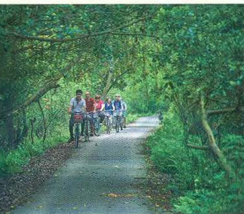
Hòa mình vào thiên nhiên tại đảo ngọc Cát Bà