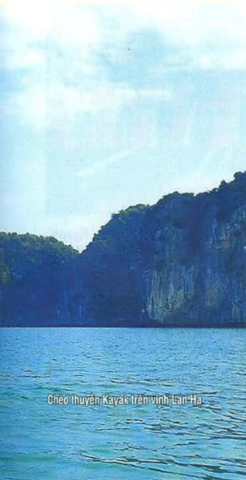
Cheo thuyền Kayak trên vịnh Lan Hạ

cao, rừng ngập mặn vùng duyên hải, vùng biển với các rạn san hô gần bờ, hệ thống hang động, thung lũng và khu dân cư tạo thành một hệ sinh thái đa dạng với hơn 700 loài thực vật khác nhau, trong đó có nhiều loài quý hiếm. Băng qua những con đường mòn và leo lên điểm cao nhất của rừng nguyên sinh, bạn sẽ phải sững sờ trước khung cảnh hùng vĩ mà tạo hóa ban tặng. Khi nắng chiều không còn oi ả cũng là lúc Vườn quốc gia Cát Bà chiều lòng du khách với những điểm check-in hút mắt.