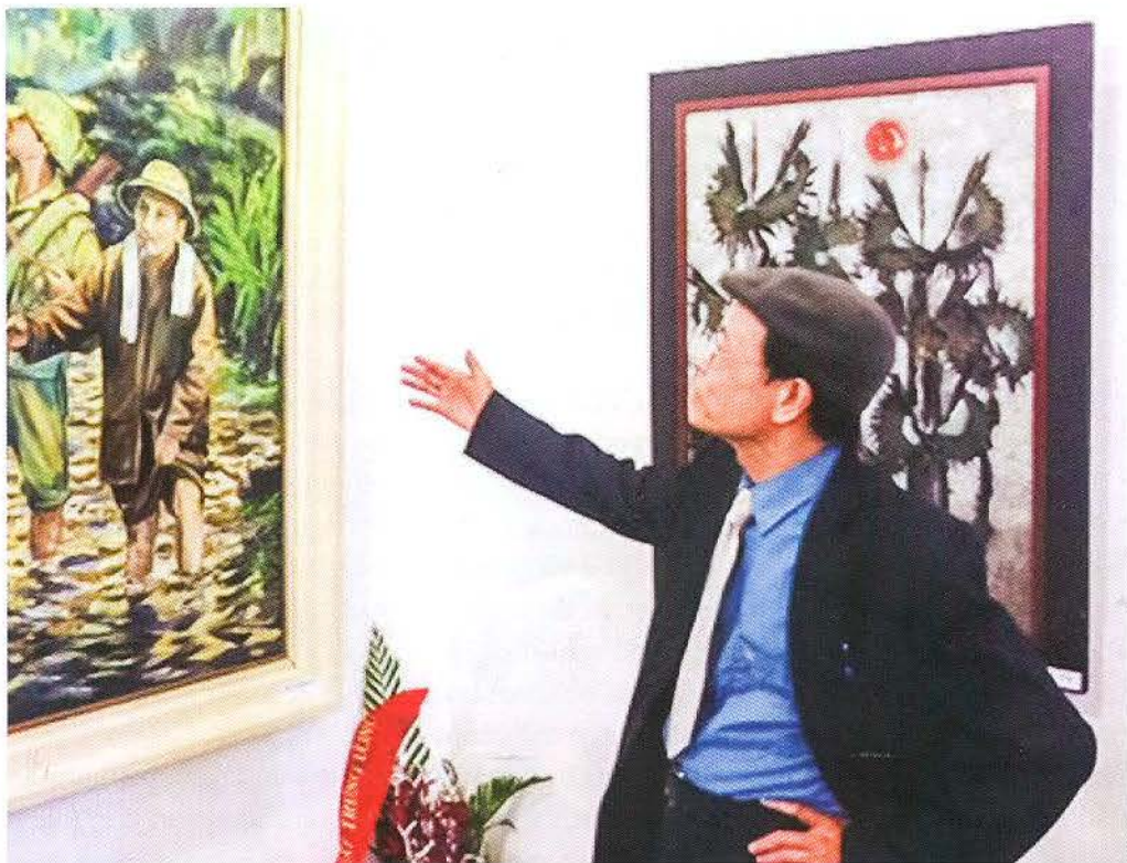
Tác phẩm "Bác Hồ đi chiến dịch" và họa sĩ Ngô Quang Nam

Với thành quả của nền hội họa dân tộc, những bức “huyết họa” chân dung Bác Hồ của những chiến sĩ, họa sĩ cách mạng đã trở thành tài sản của nhân loại. Tư tưởng và đạo đức của Bác là ánh sáng và sức mạnh tạo nên nguồn cảm xúc bất tận đối với nền nghệ thuật cách mạng. Đúng như lời của họa sĩ Lê Duy Ứng viết trong bức tranh vẽ bằng máu của mình với dòng chữ: “Ánh sáng và niềm tin”. Chính vì điều đó mà máu của các họa sĩ đã tạo nên tác phẩm xuất sắc nhất về hình tượng Hồ Chí Minh.