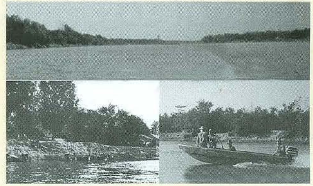
Lực lượng Mỹ nguy năm 1965 - 1966 ở chi khu An Phú thực hiện những cuộc tuần tra trên sông.