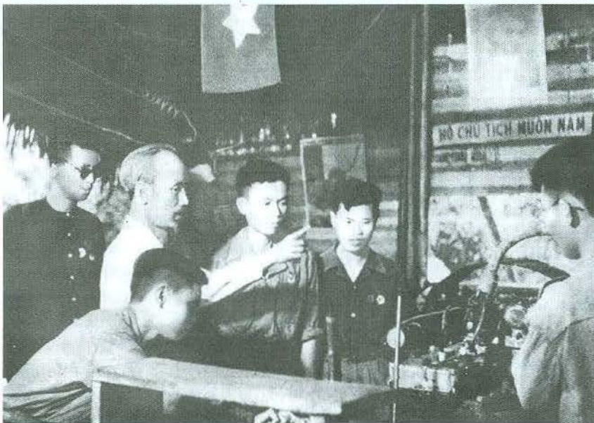
Hồ Chủ tịch thăm một xưởng công binh tại căn cứ Việt Bắc trong những năm kháng chiến chống thực dân Pháp.

Thủ tướng Phạm Văn Đồng kể: "Tháng 4/ 1954, cuộc chiến đấu ở Điện Biên Phủ đang ác liệt, tôi đến chào Bác trước khi đi Giơnevơ, Bác cho biết là sẽ