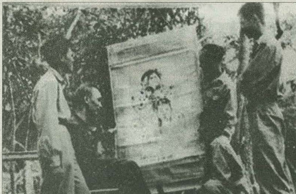
Bác Hồ xem bức tranh họa sĩ Diệp Minh Châu vẽ bằng máu, do đồng chí Trần Văn Trà trao tặng tại Việt Bắc.