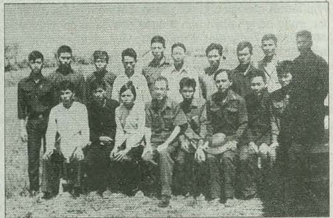
Thượng tướng Trần Văn Trà (ngồi thứ tư, từ trái sang) thăm lại chiến trường xưa ở Đồng Tháp Mười, năm 1976.

Từ năm 1947, chiến tranh du kích đã phát triển mạnh mẽ, rộng khắp ở các địa phương Nam Bộ. Đồng chí Trần Văn Trà lúc bấy giờ là Ủy viên Xứ ủy Nam Bộ, Khu trưởng Khu 8, đã tổ chức thành lập đơn vị chủ lực đầu tiên mang tên Tiểu đoàn 307, nức tiếng chiến công khắp vùng. Do yêu cầu nhiệm vụ lãnh đạo kháng chiến ngày càng khó